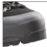
Spitzen- und Fersen- schutz aus Gummi