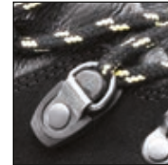
HAIX® 2-Zone Lacing