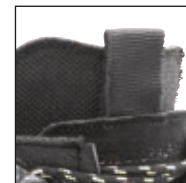
Doppelte Zunge für beste Druckverteilung und Anpassung